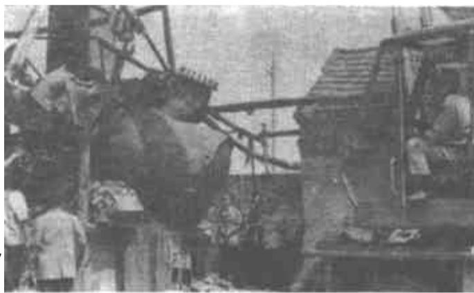
△我市油区治理第二战役,以取缔非法土炼油、小化工和各种非法收购点为重点,展开全面深层次治理。图为油区工作人员正在东营区拆除土炼油。

本报讯 市妇联和市保险公司联合举办的“权益保障法”《妇女权益保障法》知识竞赛,历时4个多月,于近日圆满结束。此次知识竞赛共发放答卷13000份,参考资料1200份,约有2万多人参加答卷,试卷回收率达99%以上。通过知识竞赛,使广大群众进一步了解了人身保险知识,提高了投保入